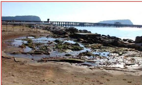
Aree prima dell'intervento

Periodo: 3 settembre 2015 – 3 settembre 2018