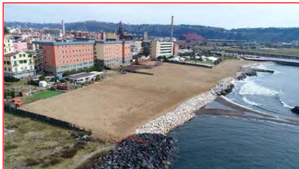
Aree dopo l'intervento